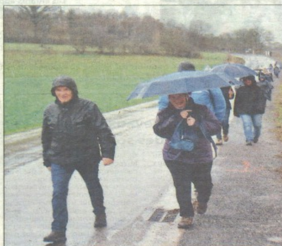
Sourire et bonne humeur en dépit de la pluie.